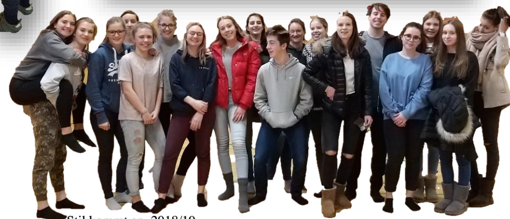
Stil kommt an 2018/19