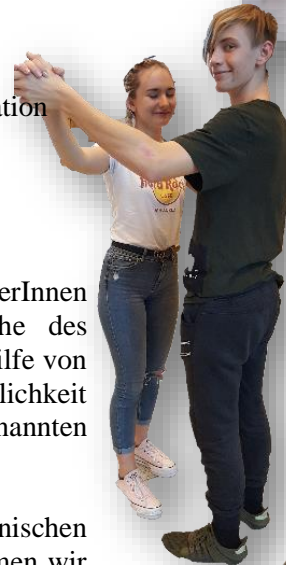
Fit für das Parkett